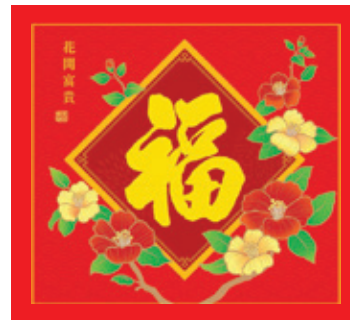
B10 (8K 日曆芯)