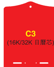
C3 (16K/32K 日曆芯)