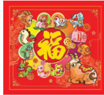
B4 (8K 日曆芯)