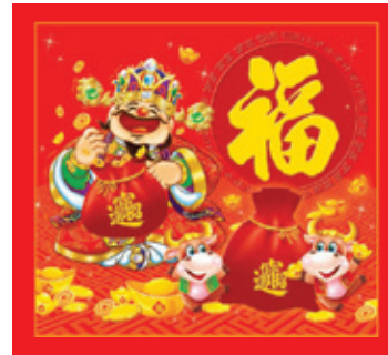
B7 (8K 日曆芯)