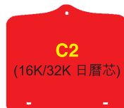
C2 (16K/32K 日曆芯)